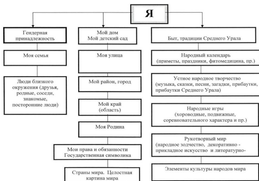
Региональная модель перспективного планирования («Я-концепция» личности)