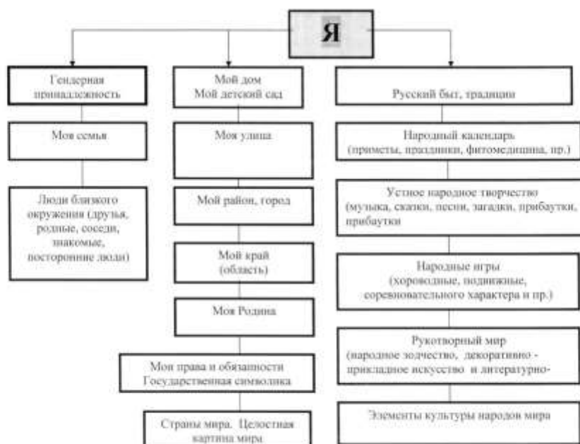
Пример региональной модели перспективного планирования («Я-концепция» личности)